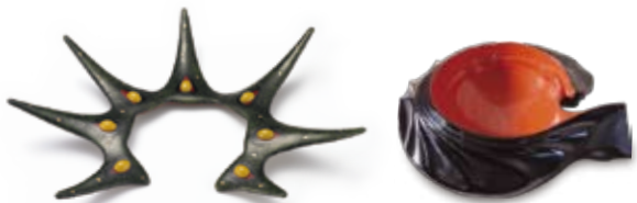
「Blooming green thorn」ユン サンヒ(韓国) 2007年制作／漆、麻布、銀、貴金属、琥珀 H390×W300×D70mm