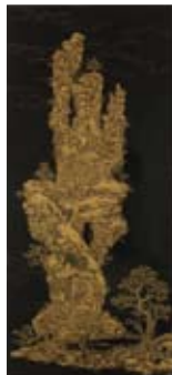
「The Mountain of the Universe」 チャンタナ チャンティム(タイ) 2005年制作／漆、木、金箔 H850×W380×D60mm