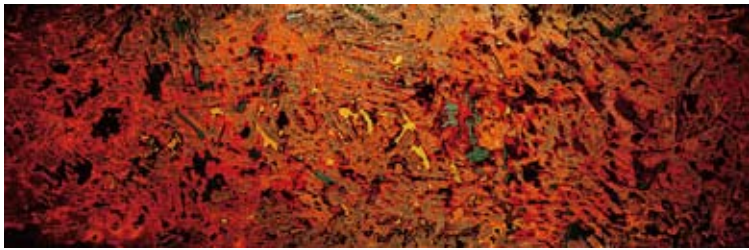
「A-Puzzling-Statement」ニャットラン(アメリカ)／2010年制作／漆、木板／H368×W978×D51mm