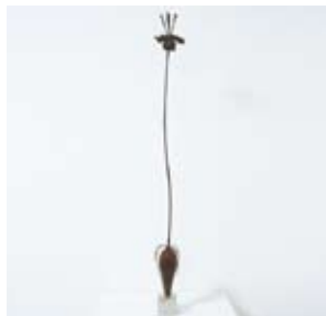
「libido」吾子 可苗(日本)／2012年制作 漆、和紙、木、金粉、銀粉、白蝶貝、金属 H850×W120×D90mm