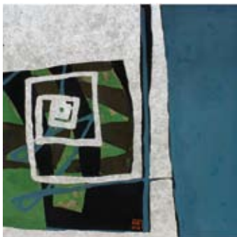
「COLLIDING」コン キム ホア(ベトナム) 2011年制作／漆、木／H550×W550×D30mm