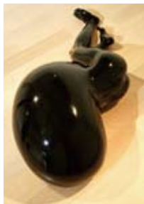
「BODY10-1」青木 千絵(日本) 2010年制作 漆、麻布、スタロフォーム H500×W1700×D900mm