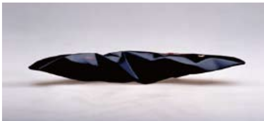
「夢を追う」馮 曉娜(中国)／2011年制作／漆、麻布／H75×W280×D50mm